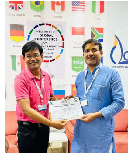
(जून)20 जून 2023