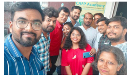
(जून)25 जून 2023