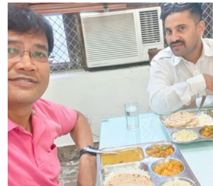
(जून)27 जून 2023