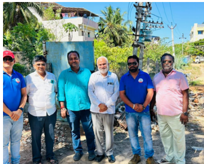
(जून)12 जून 2023