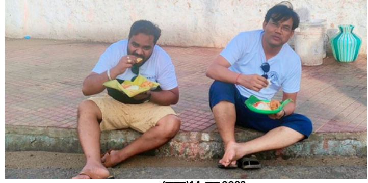
(जून)14 जून 2023

सुबह की नाश्ता कन्याकुमारी में, Street Food इडली, सांभर, नारियल चटनी, टमाटर चटनी का शानदार नाश्ता। एक अम्मा बनाकर बेच रही थी। इसका एक अपना अलग आनंद है, सबकी बस की बात है इसका असली आनंद लेना। दुनिया में आए हो तो हर वह चीज का आनंद ले जो आप चाहते हैं। यह तस्वीर आने वाले समय में आपको जीवंत रखेगी और सकारात्मक ऊर्जा प्रदान करेगी। आप खुश और मस्त हैं दुनिया भी मस्त ही लगेगी। इसलिए खुद को जीने के बहाने को कभी छोड़े नहीं।