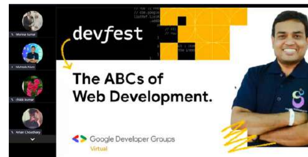
(जून)07 Oct 2023