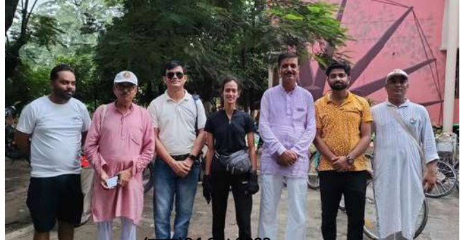
(जून)04 Oct 2023