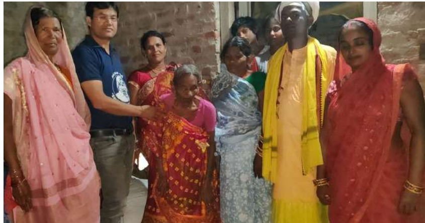
(जून)26 Oct 2023

“देखते पहले बोलेगी अपना तमाशा न देखायेबा। बुलंद आवाज, आंख की रौशनी मस्त, बिना लाठी का भी दौर जाती और बाइक पर बैठकर दुनिया की सैर। पोता, पोती, परपोता, परपोती, कई बहू के साथ सैकड़ों सदस्य हो चुके हैं परिवार में। एक शानदार व्यक्तित्व और यादास्त एकदम गूगल के जैसा सर्वर बना दी हो अपने दिमाग को। अद्भुत, सबको आवाज सुनकर पहचान जाती है फूआ। आप अभी मस्त, जबरदस्त और तंदुरुस्त रहे। आपका आशीर्वाद मिलते रहे।”