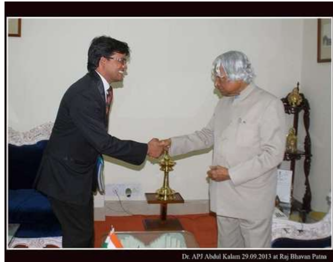
Dr. APJ Abdul Kalam 29.09.2013 at Raj Bhavan Patna