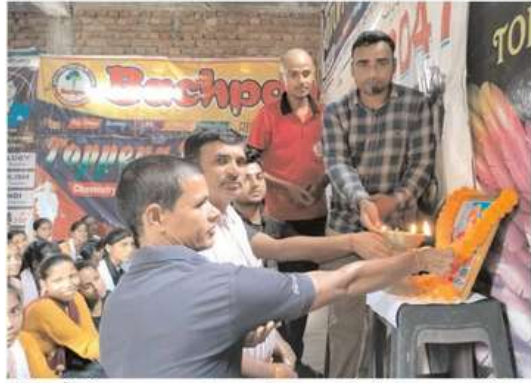
पकड़ीदयाल में युवा संवाद भारत 2047 कार्यक्रम का आयोजन हुआ।