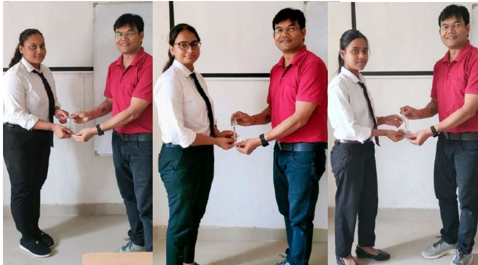
(जून)17 Oct 2023