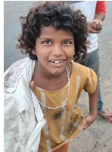
(जून)2 Oct 2023

आप अपने पंचायत/गाँव/मुहल्ला में शैक्षणिक जागृति हेतु खाब फाउंडेशन ऑफिस से जानकारी ले सकते हैं ।