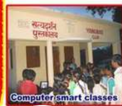
Computer smart classes