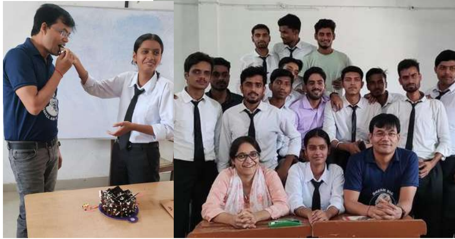
(जून)19 Oct 2023

जन्मदिन की हार्दिक शुभकामनाएं और बधाइयां।