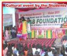
Cultural event by the Students