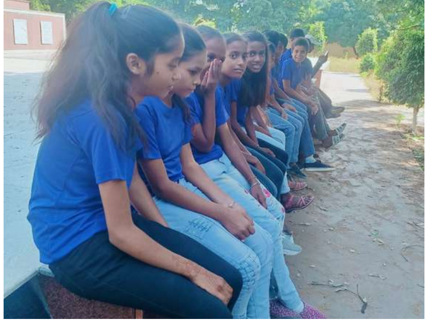
(जून)25 Oct 2023

आगे आएं और अपने समाज के बच्चों को समुचित मार्गदर्शन के साथ राष्ट्र-निर्माण में अपनी भूमिका निभाएं।