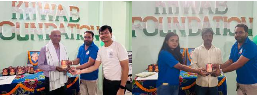
(जून)15 Oct 2023