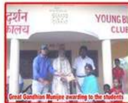
Great Gandhian Manjive awarding to the students