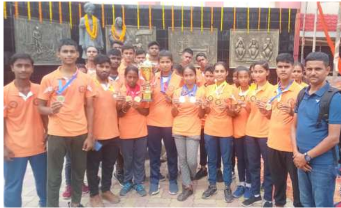
(जून)03 Oct 2023