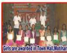
Girls are awarded in Town Hall, Motihari