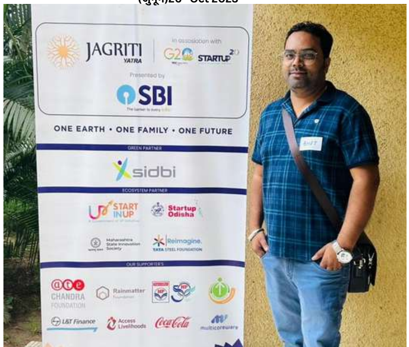
(जून)27 Oct 2023