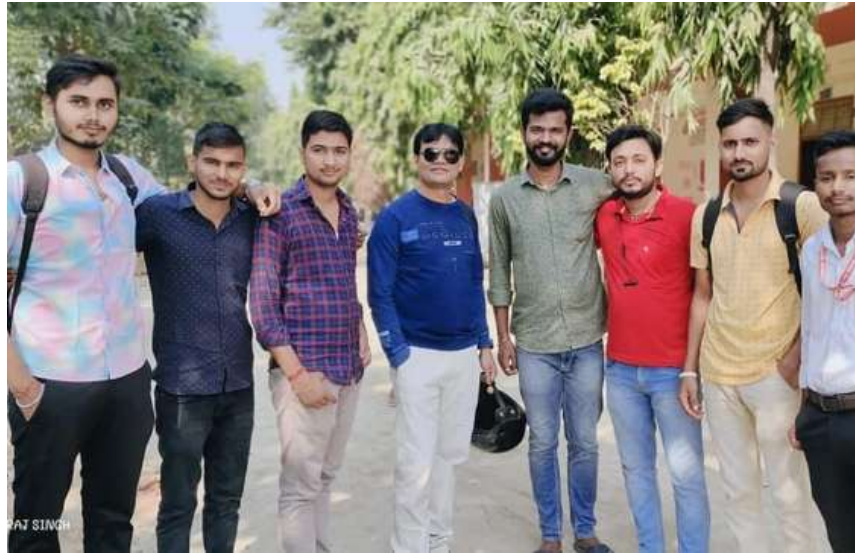
(जून)30 Oct 2023

LND College के कुछ प्रिय शिष्यों के साथ यादगार तस्वीर।