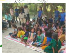
Helpless With Aim