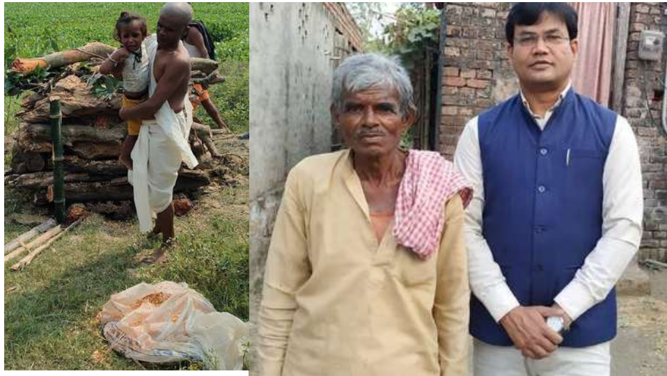
(जून)15 Oct 2023

ख्वाब फाउंडेशन के माध्यम से आर्थिक रूप से कमजोर बच्चों के लिए कई हैप्पी स्कूल का संचालन कर रही है। अब ऐसे बच्चों को निशुल्क कोडिंग की पढ़ाई कराई जाएगी।