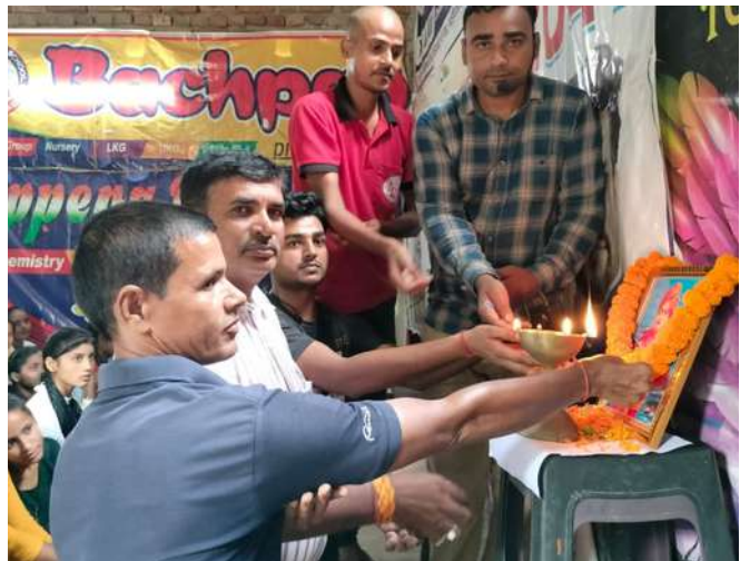
(जून)03 Oct 2023