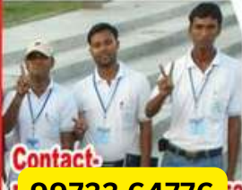
Contact: 99733 64776