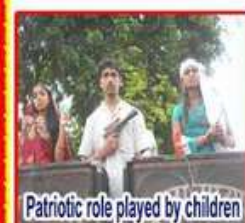
Patriotic role played by children