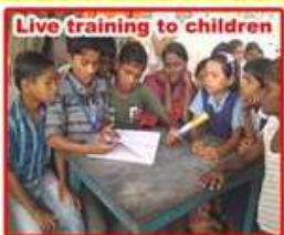
Live training to children