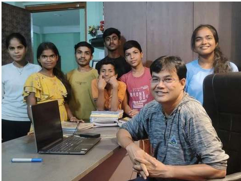
(जून)19 Oct 2023