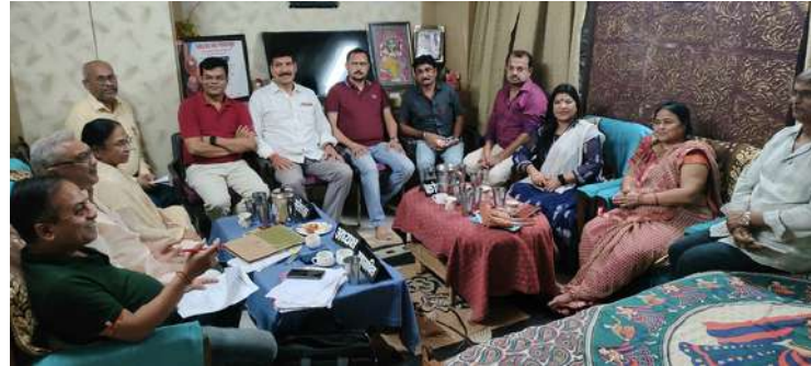
(जून)01 Oct 2023