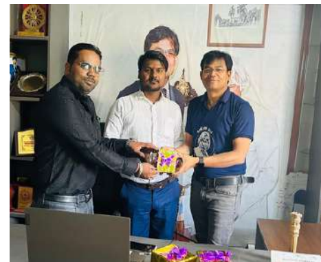
(जून) 21 Oct 2023