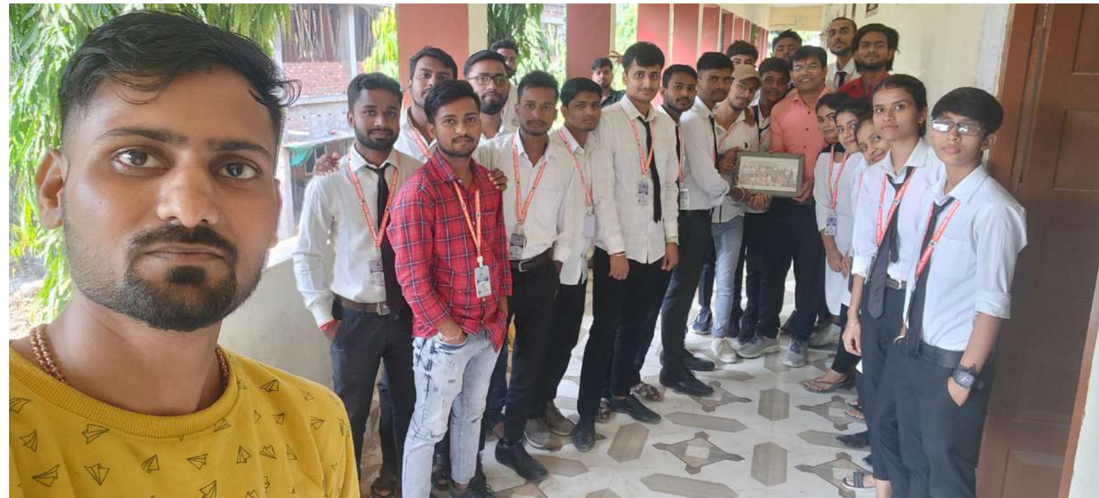
(जून)31 Oct 2023