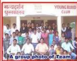
A group photo of Team